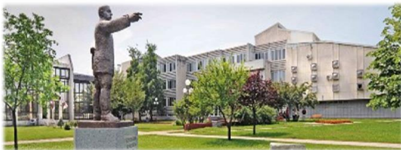
Слика 4. Део дворишта Ректората Универзитета у Крагујевцу