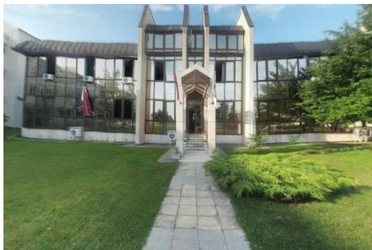
Слика 3. Зграда Ректората Универзитета у Крагујевцу